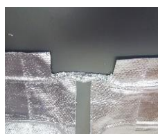
Výsledný tvar, netreba lepiť spoje.