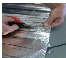
Koniec strihu. POZOR na kábel!