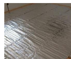
Rozloženie rohože na Izola™ 6 mm izoláciu.